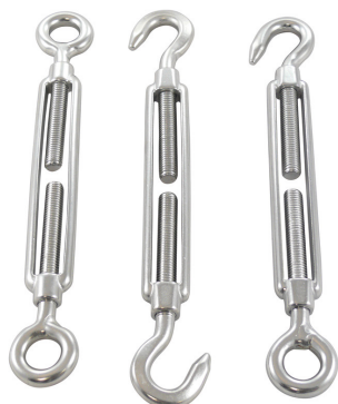
A B C